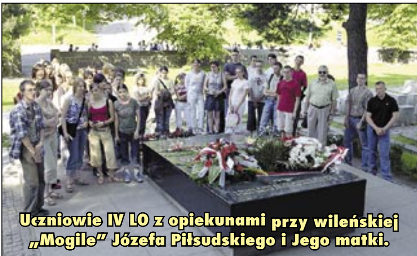
Uczniowie IV LO z opiekunami przy wileńskiej „Mogile” Józefa Piłsudskiego i Jego matki.

Ostatnie godziny pobytu w Wilnie poświęcamy na błądzenie po jego ulicz-