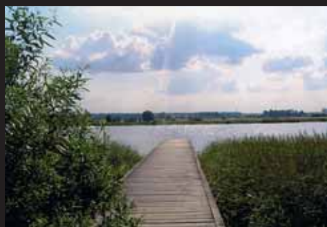
III miejsce Paula Staręga