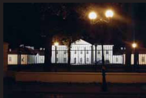
III miejsce Łukasz Somla